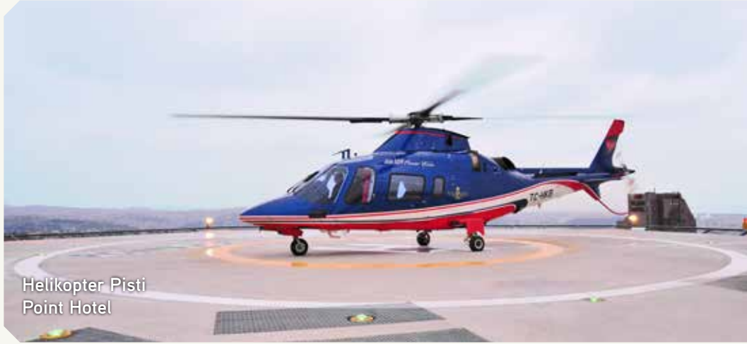
Helikopter Pisti Point Hotel