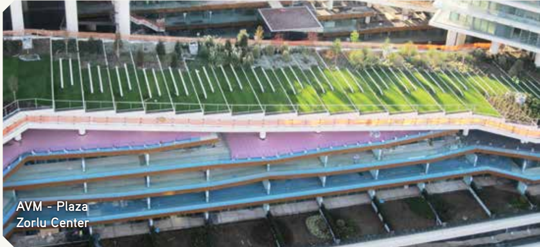
AVM - Plaza Zorlu Center