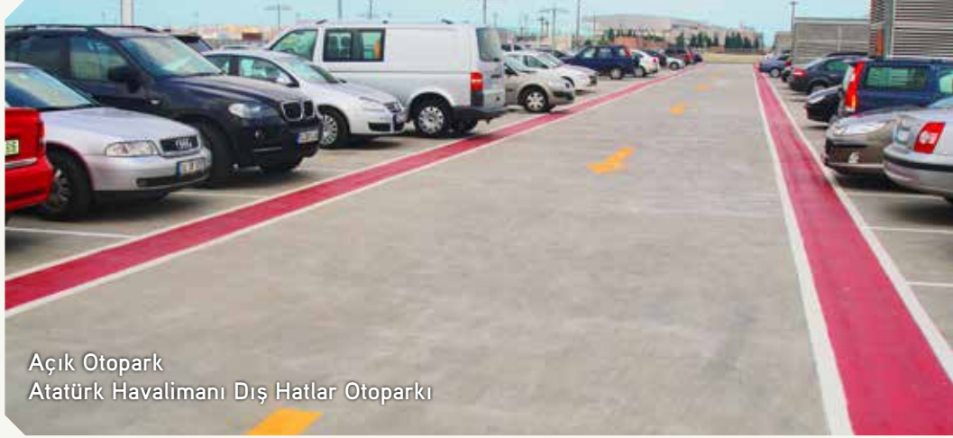
Açık Otopark Atatürk Havalimanı Dış Hatlar Otoparkı