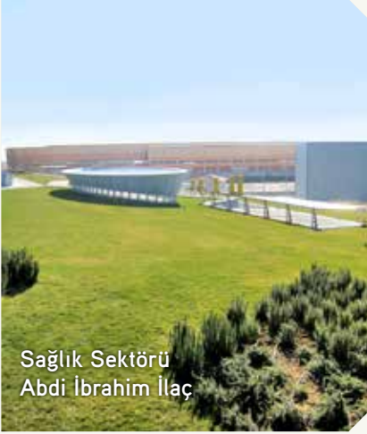
Sağlık Sektörü Abdi İbrahim İlaç