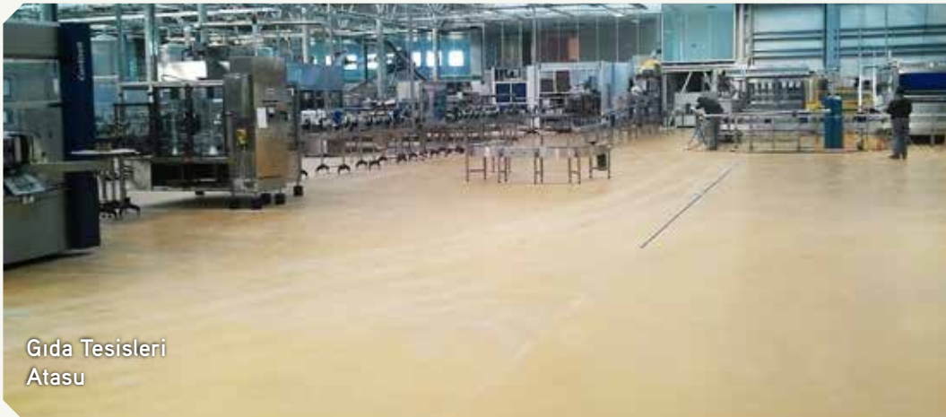
Gıda Tesisleri Atasu