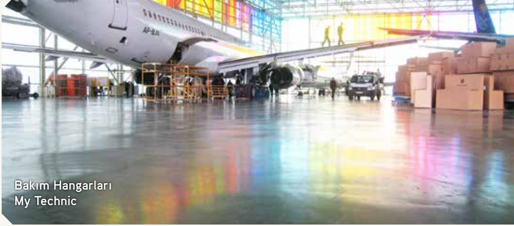
Bakım Hangarları My Technic