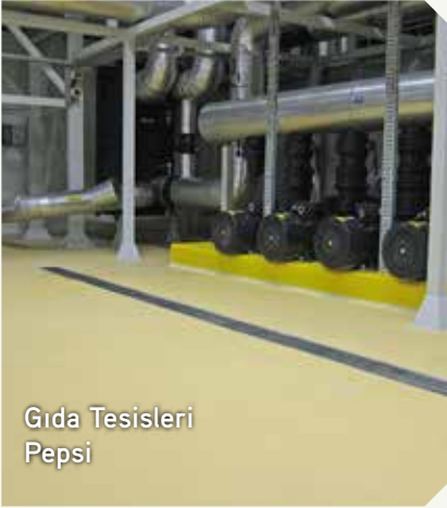
Gıda Tesisleri Pepsi