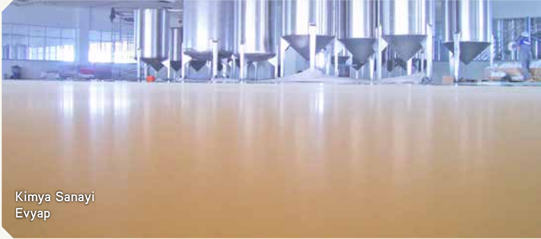
Kimya Sanayi Evyap