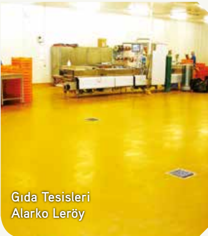
Gıda Tesisleri Alarko Leröy